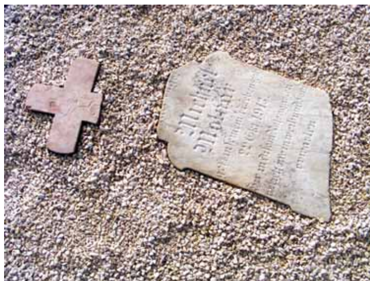
Angela Hodoniczki: Zerbrochen, aber aufbewahrt

Die zerbrochenen Grabsteinen wurden in Wikitsch/Bácsbokod im Pietätpark in Schotterbett gelegt und so aufbewahrt.