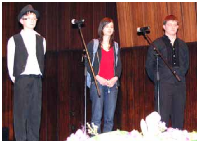
Erfrischend wirkten die Jugendlichen mit ihren Mundartgeschichten.