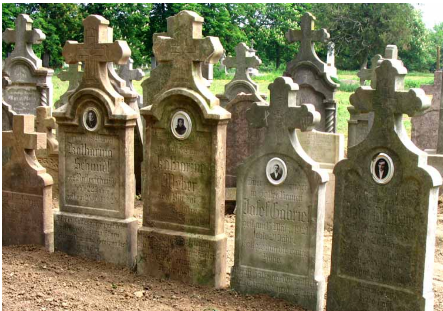
Hedvig Heffner: Ruhet in Frieden