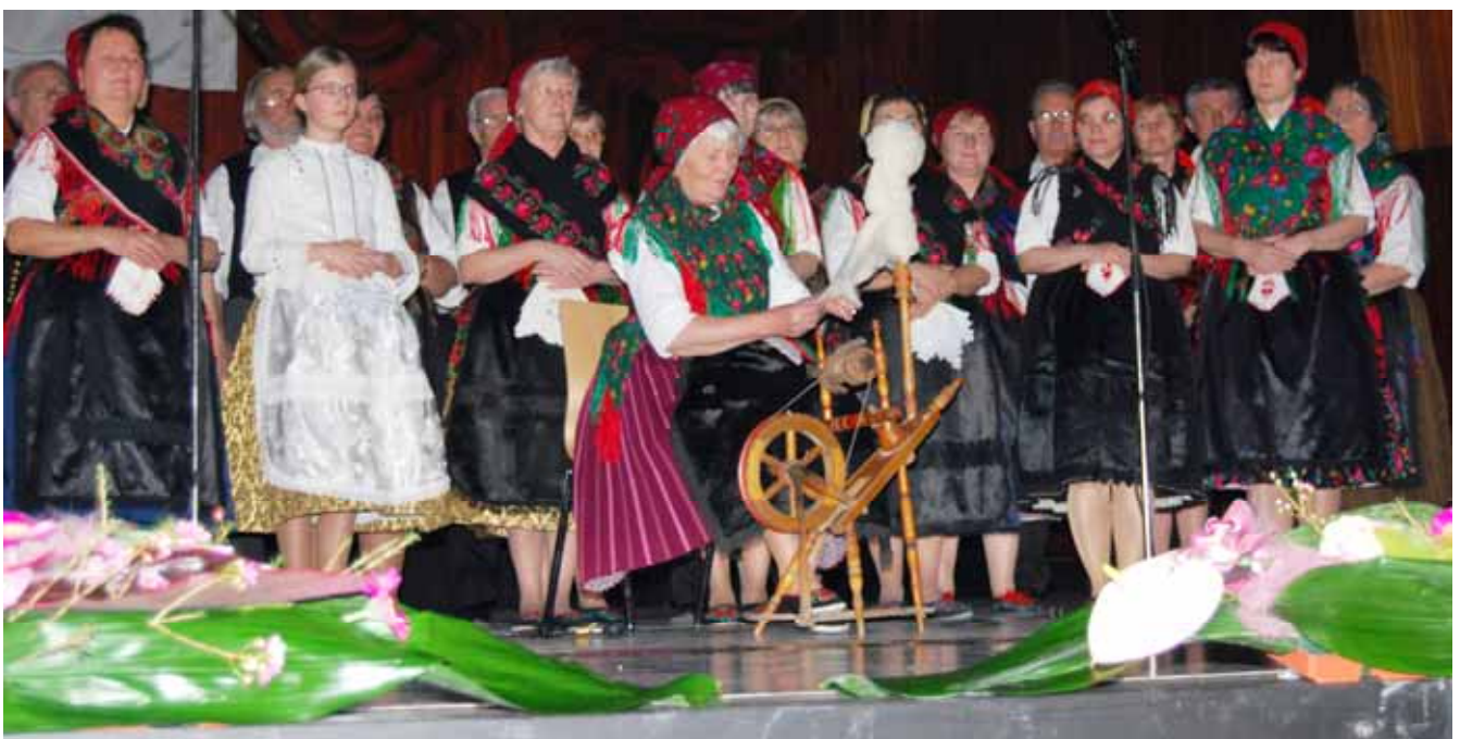
Modschein Chorvereinigung aus Saksard/Szekszárd