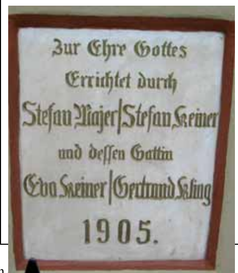
Dieses Kreuz steht in Gara in der Dózsa Straße und wurde durch