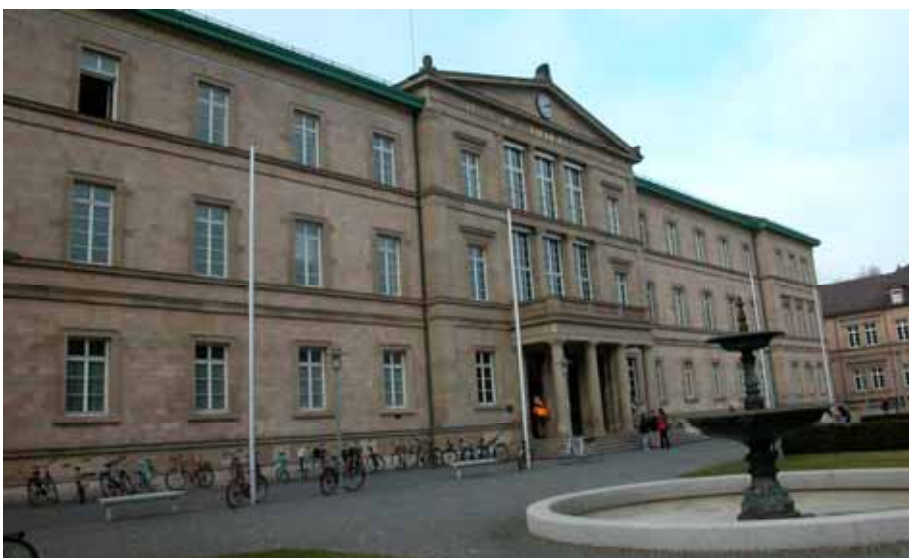
Die berühmte Universität in Tübingen