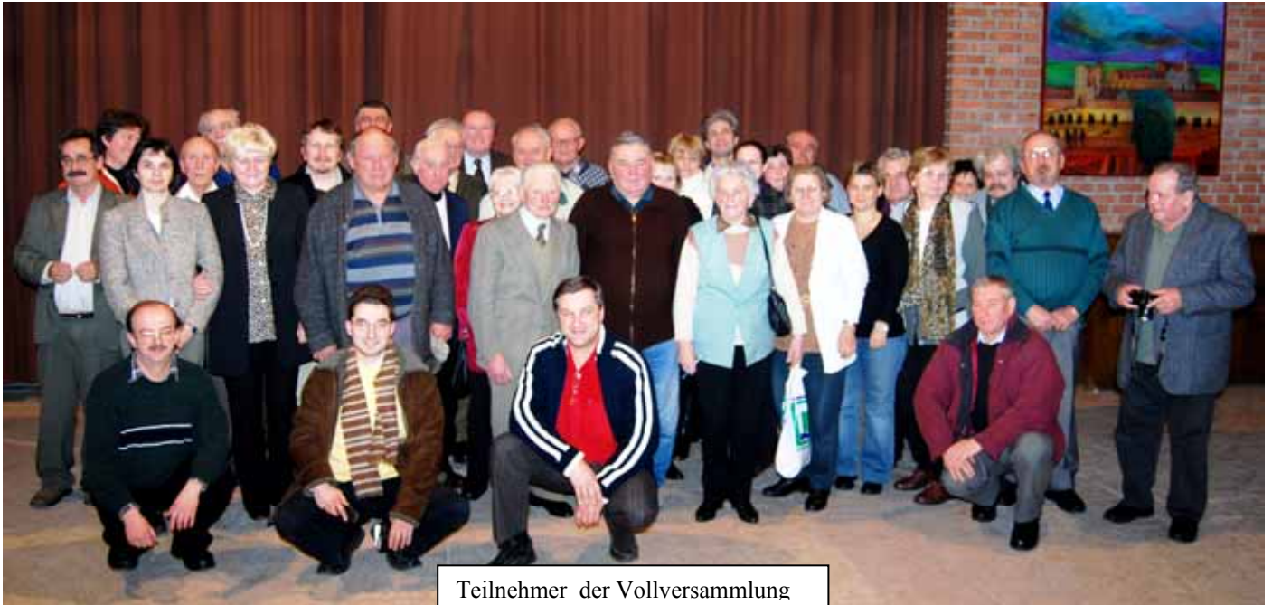
Teilnehmer der Vollversammlung

Am 13. Februar 2009 fand die Jahresvollversammlung des „Deutschen Kulturvereins Batschka“ im Ungarndeutschen Bildungszentrum statt. Gemäß der Einladung mussten drei Tagesordnungspunkte abgewickelt werden: