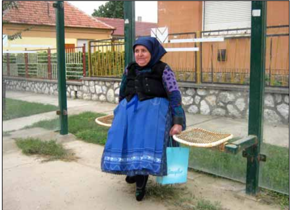
Preisträger – Foto: Eva Schulteisz - Ich warte auf den Bus

Das Ungarndeutsche Kultur- und Informationszentrum (Zentrum) feiert dieses Jahr seinen 5. Geburtstag, und für das Jubiläumsjahr war BlickPunkt ein ausgezeichnete Auftakt. Das Zentrum arbeitet an einer Internetseite für die Ungarndeutschen ( www.zentrum.hu ), damit die Interessenten eine einfache Plattform erhalten, wo sie leicht Informationen über die Ungarndeutschen finden bzw. ihre Informationen veröffentlichen können.